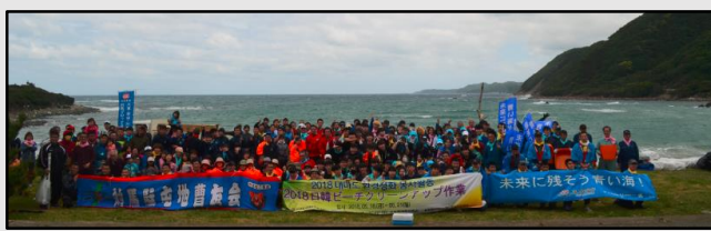
スタディツアー(日韓学生によるビーチクリーンアップの様子)