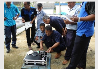
インドネシアでの水道技術者育成