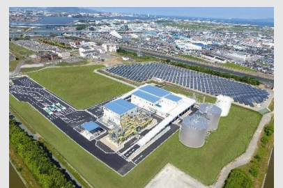
国内最大規模の 豊橋市バイオマス利活用センター