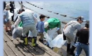
海岸清掃美化活動