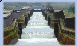
落差を有する農業用水路