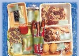
県内で捨てられた手付かずの食品