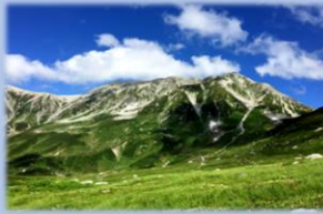
室堂平から見た立山連峰