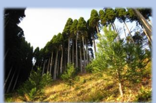
伐採跡地に植栽された優良無花粉スギ「立山 森の輝き」