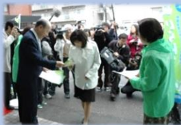
店頭でのマイバック持参呼びかけ