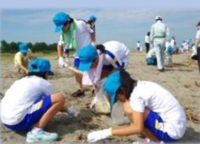
各国での漂着物調査