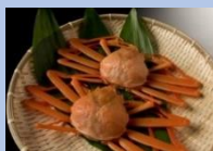
富山湾の朝陽【高志の紅(アカ)ガニ】