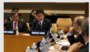
2018国連SDGs推進会議での市長スピーチ