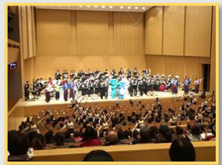
SDGs吹奏楽団コンサート

⇒SDGs市民認知度が11%(平成29年11月)から、 46.5% (令和2年2月)に上昇