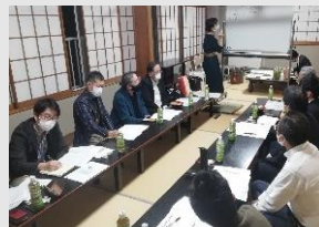
▲多様な企業が集まるワークショップやマルシェ

錦二丁目を舞台に地域課題解決・SDGs達成への事業を検討SDGsを体感できるマルシェを都心の道路空間で開催