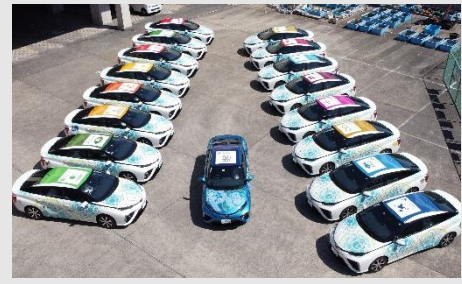
▲屋根に17のゴールを付けたFCV