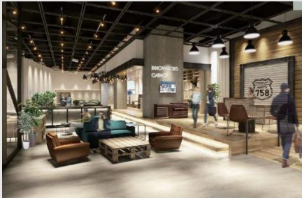
▲イノベーション拠点 「ナゴヤ イノベーターズ ガレージ」