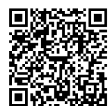
▲SDGsを楽しみながら学べるウェブサイトを開設