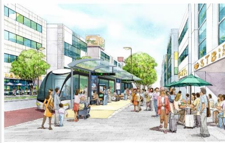
▲新たな路面公共システム (SRT)イメージ